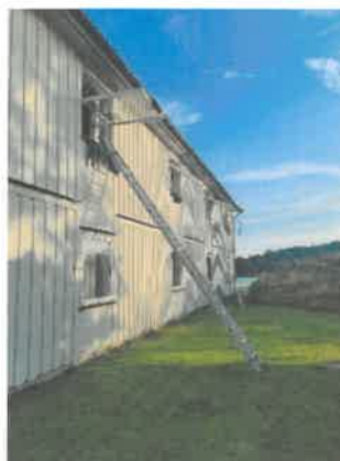
Det planlegges for nattsprell!

I 2024 var det kun høstkonfirmasjon, noe som fungerte godt, men vi må huske til 2025 at når en fjerner en konfirmasjon på våren, må man legge til en på høsten. Det ble litt vel trangt om plassene i kirka, og mange konfirmanter på hver gudstjeneste, men utover det gikk det greit. I 2025 legger vi opp til 5 gudstjenester, 3 på lørdag og 2 på søndag.