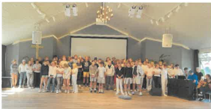
Alle konfirmantene samlet!