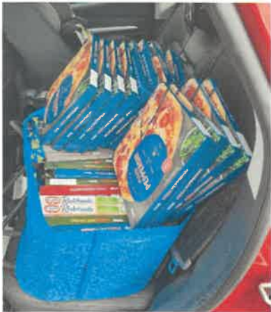
Måltidsfelleskap er viktig