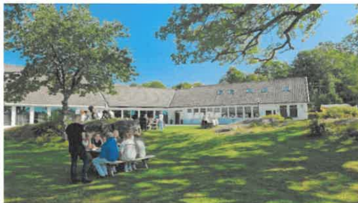
Gruppesamtaler på leir i det fri.

Det var i 2024 hele 96 konfirmanter, 7 på Miksgruppen og 89 på sommergruppen. Miks-helgen, deres svar på konfirmantleir, ble holdt i Høvik menighetshus og kirke, og gikk fint for seg. Nytt av 2024 var at vi ikke lenger gjennomførte vinterleir, grunnet lav oppslutning fra konfirmantene, utfordringer med å skaffe ledere og til sist fordi det krever store ansattressurser. Sommerleir ble dermed åpen for «alle». Sommerleir ble på grunn av dette den største Lommedalen noensinne har hatt, med 110 deltakere (inkludert frivillige og ansatte). På leir var kateket, kapellan, ungdomsarbeider og en ung voksen som vikarierte for diakonstillingen. Utover dette var det en stor gjeng ungdommer og unge voksne som var med på å få skuta i havn. Konfirmantleir er fortsatt mobilfri noe som fortsatt går fint for seg, og når konfirmantene kommer til oss i etterkant av innsamlingen og innrømmer at de har med mobil, ja da føler vi at jobben med å skape et trygt og tilgivende rom har fungert.