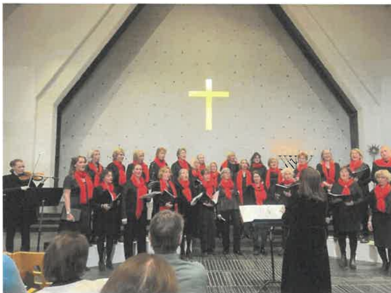
Nye røde skjerf støttet av Lauvsprett på julekonserten